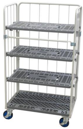
棚 3 枚使用時