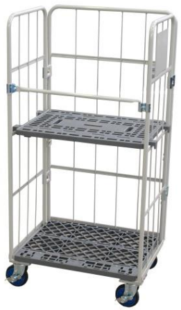
棚 1 枚使用時